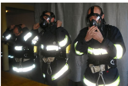
Zur Erlangung des ASLP in Bronze müssen 4 Stationen positiv bewältigt werden.