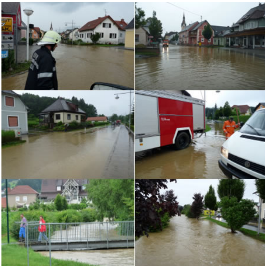
Hochwasser am 06.09.2009—die Ortsdurchfahrt ist für den Fahrzeugverkehr unpassier-

Das Jahr 2009 war ein sehr niederschlagsreiches Jahr. Die Wetter-Tiefs waren geprägt von lang anhaltenden und intensiven Niederschlägen. Das Erdreich konnte die enormen Wassermassen nicht mehr speichern, die Folge waren über die Ufer steigende Bäche und in der Folge überflutete Straßen, unter Wasser stehende Keller, sowie auch Hangrutschungen und daraus folgend unpassierbare Straßenabschnitte. Wenn dann an niederschlagsreichen Tagen die Sirene am First des Rüsthauses aufheulte, konnten sich die ausrückenden Feuerwehrmitglieder auf einen erneuten arbeitsintensiven Einsatz vorbereiten. Die Feuerwehren im ganzen Land, unter anderem auch die FF-Paldau waren gefordert, den Mitbürgern der eigenen Gemeinde, sowie auch denen der Nachbargemeinden beim Beseitigen der entstandenen Schäden zu unterstützen. Die Einsätze schienen an solchen Tagen kein Ende zu nehmen. So mussten im heurigen Jahr eine Vielzahl an Kellern ausgepumpt werden. Weiters mussten zahlreiche Straßen nach Rückgang des Hochwassers vom Schlamm gereinigt werden, um ein Befahren für den Fahrzeugverkehr wieder zu ermöglichen. Die Ortsdurchfahrt von Paldau stand heuer so einige Male unter Wasser, ein Befahren der Ortsdurchfahrt war so einige Male nicht gewährleistet. Neben der intensiven Reinigung, musste