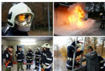
Ein paar Impressionen aus dem GAB 2 in Lebring

Der zweite Teil der Grundausbildung (GAB 2) fand am 08.11.2009 in der Feuerwehrschule in Lebring statt. Auch