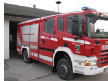
Diese Bilder lassen jedes Feuerwehrherz höher schlagen