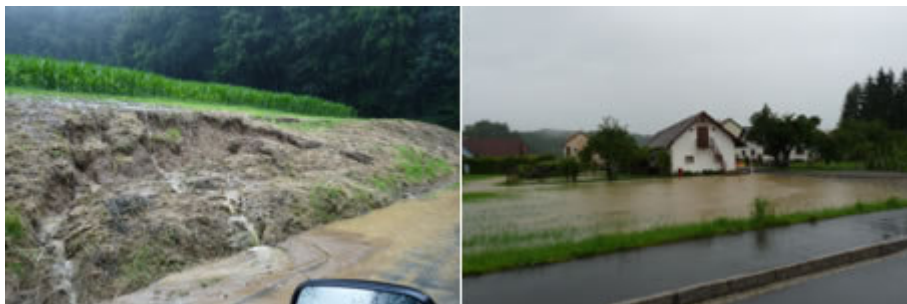
Das Erdreich kann die Wassermassen nicht mehr speichern, Hangrutschungen und Überflutungen sind die Folge.