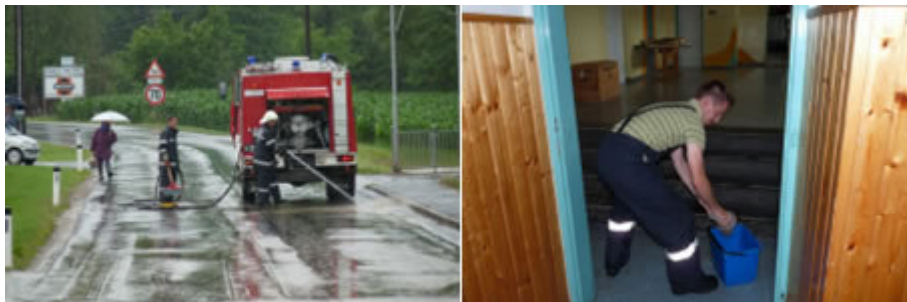
Die Beseitigung der Hochwasserspuren gestaltet sich als sehr arbeitsintensiv